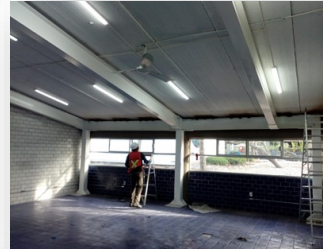
“EMPEDRADO EL ROMERAL”. Corregidora, Qro.

Mejoramiento de terracerías, guarniciones, banquetas y empedrado ahogado en mortero. 15,250 m 2 Empedrado 3,500 ml Guarnición 4,500 m 2 Banqueta