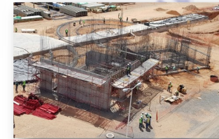
“KROMBERG & SCHUBERT”. San Francisco del Rincón, Gto. OBRA CIVIL

- Planta germinadora con piso fijo. Túnel para transportación de materia prima de concreto armado de longitud de 150 ml; tanques germinadores y ventiladores.