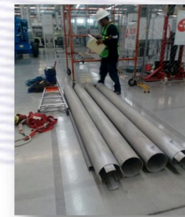
“DRÄXLMAIER LAGOS”. Lagos de Moreno, Jal. OBRA CIVIL

-Cimentación Zapatas Corridas: 200 ml -Cimentación Muros Pre-colidados: 360 ml -Muros Cortafuego: 5,000